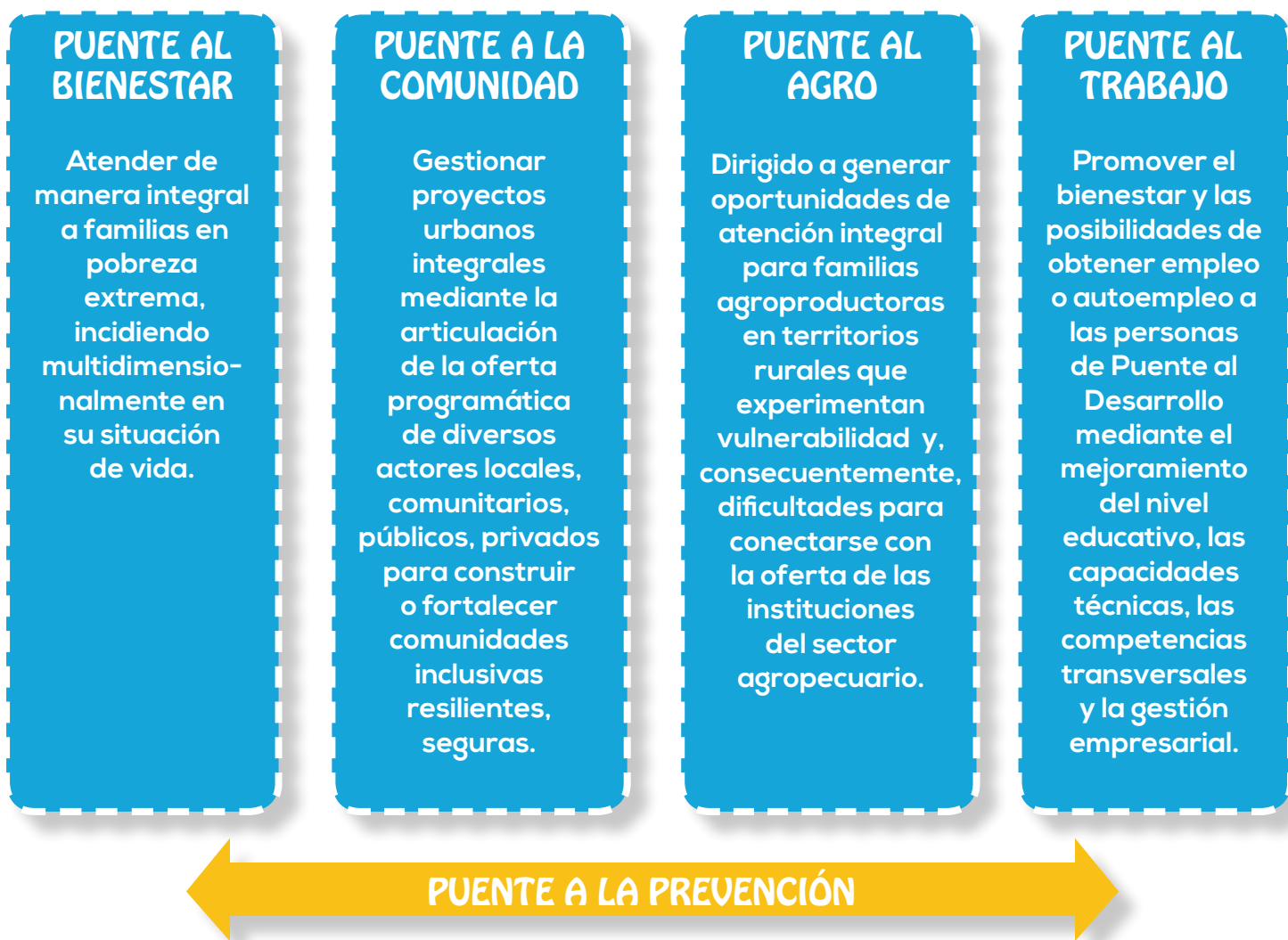
Figura 1. Estrategia Nacional Puente al Desarrollo. Costa Rica, 2020