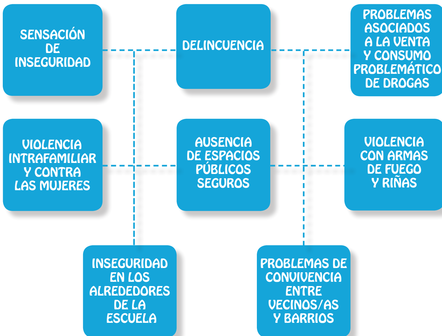
Diagrama 1. Principales problemáticas de inseguridad y violencia

Ese es precisamente el objetivo de las etapas de recolección de información, tanto las documentales como las participativas. En el siguiente acápite se realiza una descripción y análisis de las principales problemáticas identificadas en el proceso participativo.